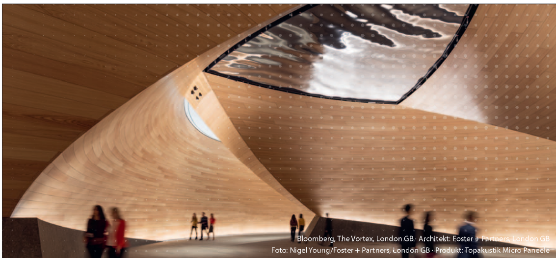
Bloomberg, The Vortex, London GB · Architekt: Foster + Partners, London GB · Produkt: Topakustik Micro Paneele

Topakustik ist eine weltweit aktive Marke und Hersteller von schallabsorbierenden Decken- und Wandsystemen aus Holzwerkstoffen. Die Elemente werden auf modernen Anlagen nach den Vorstellungen unserer anspruchsvollen Kunden in Lungern OW produziert. Zur Ergänzung unseres Verkaufsteams suchen wir dich als